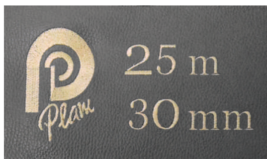
Pelle personalizzabile con diametro e lunghezza Customizable leather with diameter and length

Possono essere realizzate in qualsiasi diametro e lunghezza. / They can be produced in any diameter and length.